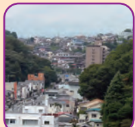
塩竈市展望台からの景観