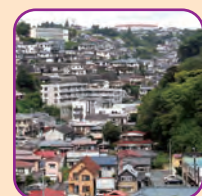
塩竈市展望台からの景観