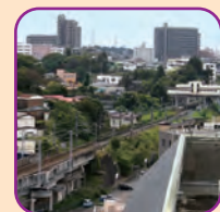
塩竈市展望台からの景観